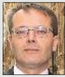
di LEO TURRINI

La mostra di Vasco Rossi e il cesto di tartufi